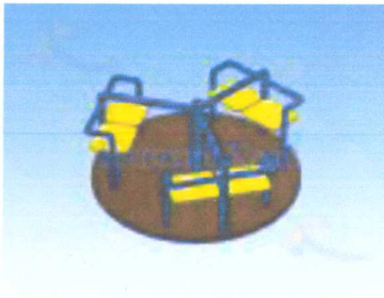
Карусель (6 мест) d=1620мм, h=700мм З.б. 5620 мм