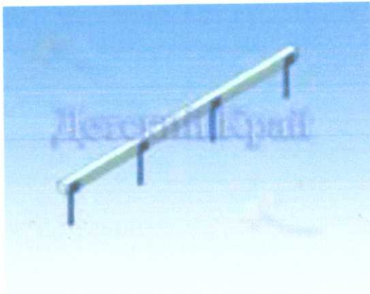
Бревно 3700*120*400мм 3.б. 5700*2120 мм