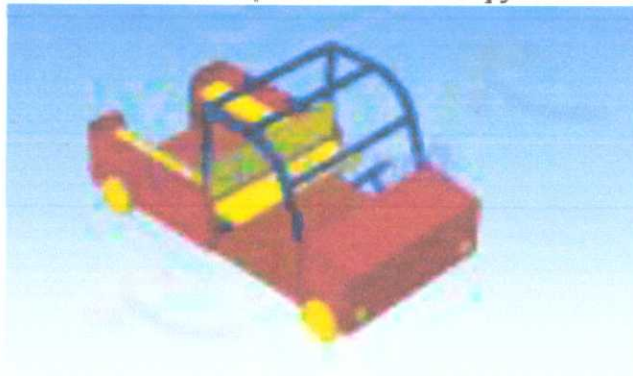
Грузовик 2000*900*1000мм З.б. 4000*2900 мм