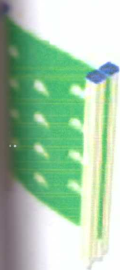
Альпинистская стенка 1220x230x1500 мм