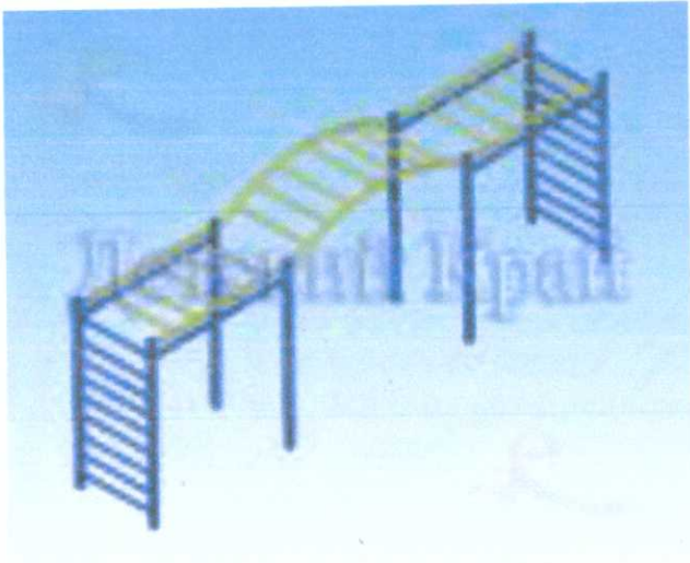
Рукоход со шведской стенкой 4500x800x2470 мм 3.б. 6500*2800 мм